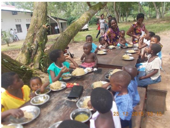
Kerstmis: ons middagmaal / Noël, notre repas