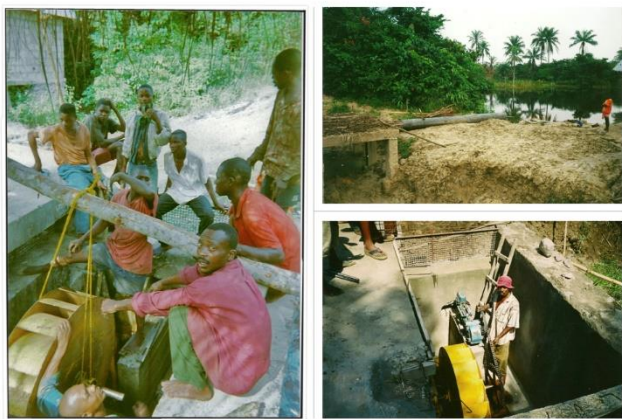
het rad- de buizen en de motor/ la rou- les tubes et le moteur

Daarnaast bouwt Appie samen met een Scheutist een ingenieuze aquaduct met een rad en een pomp (in België gemaakt) die onder zeer hoge druk het water van de rivier naar het jongerendorp één kilometer verder en over een hoogteverschil van zeker zestig meter bracht. Daar werd het in een grote watertank verzameld, zodat de jongens niet steeds honderden meters naar beneden en naar boven moesten met emmers. Deze constructie heeft jaren gewerkt en werd vele keren hersteld door hem. Nu is de pomp stil gevallen