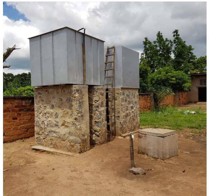
watertanken /citernes d'eau